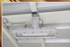
安全増防爆型LED照明