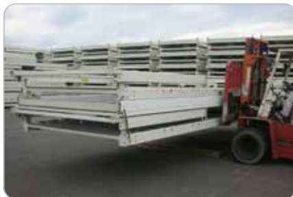
通常作業での使用例