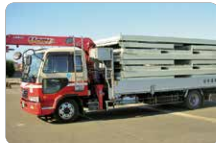
折りたたみ輸送時