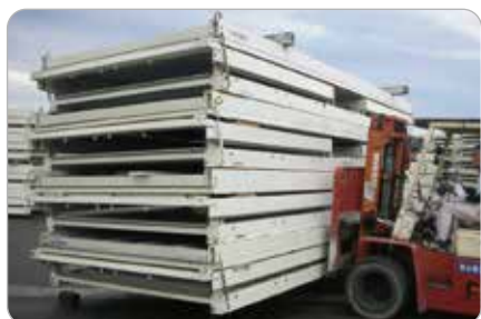
強度試験（社内基準）